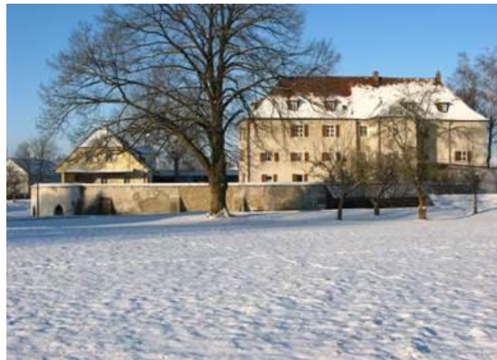
Schloss Polsingen heute