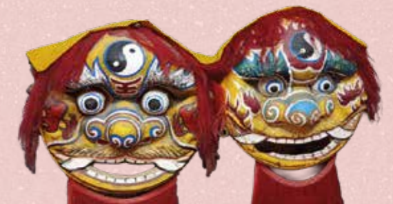
Maul des Löwen